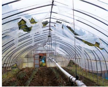
風害により被害を受けたハウス